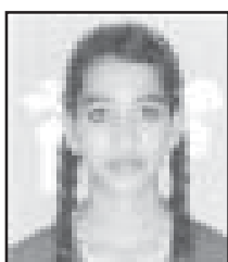
Angel Joy Bible Quiz Junior I Pulinkara