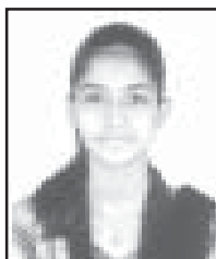
Agnus Pious സിംഗിൾ ഡാൻസ് II Kuzhikattukonam