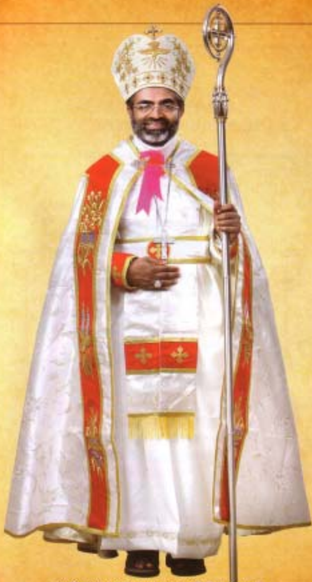
ഇരിങ്ങാലക്കുട രൂപതയുടെ വിഹിത ഇടതൻ മാർ പോളി കണ്ണുകൊടൻ പിതാവിന് രൂപതാകുടുംബത്തിന്റെ പ്രാർത്ഥനാശേഷകൾ