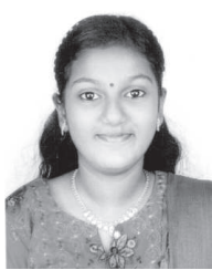
സ്നേഹ ജോണി പ്രസംഗം സീനിയർ II nd