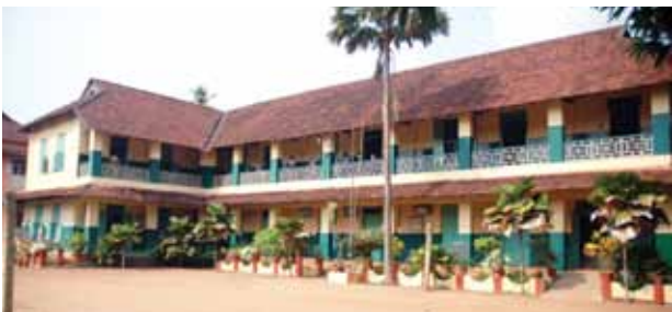
സെന്റ് ആൻസ് ഗേൾസ് ഹൈസ്കൂൾ