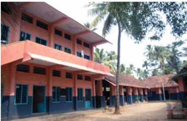
പള്ളിയുടെ ആർ. സി. യു.പി. സ്കൂൾ