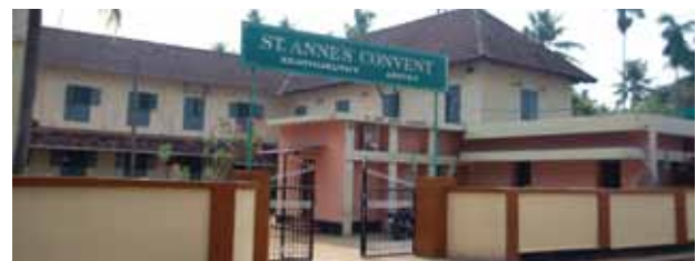
സെന്റ് ആൻസ് കോൺവെന്റ് (CMC)

വിദ്യാഭ്യാസ സ്ഥാപനമാണ് കാട്ടൂർ പോംപെ മാതാവിന്റെ നാമധേയത്തിലുള്ള ഹൈസ്കൂൾ. ഇടവകയുടെ പരിധിയിൽ ഇതര മതസ്ഥരുടെ ആരാധനാലയങ്ങളും പൊതുജന സേവനത്തിനായുള്ള ഇതര സ്ഥാപനങ്ങളും പ്രസ്ഥാനങ്ങളും പ്രവർത്തിക്കുന്നുണ്ട്.