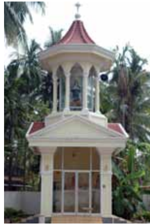
വാ.ഏവുപ്രാസ്യമ്മയുടെ ജന്മഗൃഹ കപ്പേള