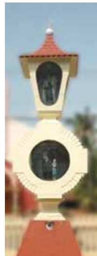
വിൻസെന്റ് ഡി പോൾ കപ്പേള

എടത്തിരുത്തി മഠത്തിനോടനുബന്ധിച്ച് 1915-ൽ സ്ഥാപിച്ച ഉണ്ണീശോയുടെ കപ്പേളയും പടിഞ്ഞാട്ടുമുറിയിൽ വി. യൗസേപ്പ് പിതാവിന്റെ കപ്പേളയും സ്ഥിതി ചെയ്യുന്നു. 1850-ൽ എടത്തിരുത്തി