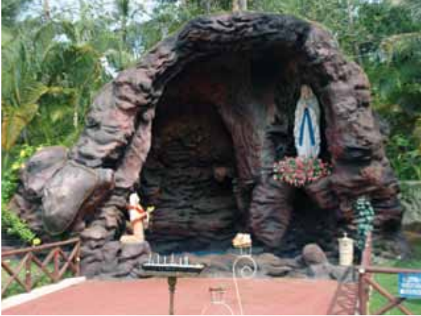
പള്ളിയകണത്തിലെ മാതാവിന്റെ ശ്രോട്രോ