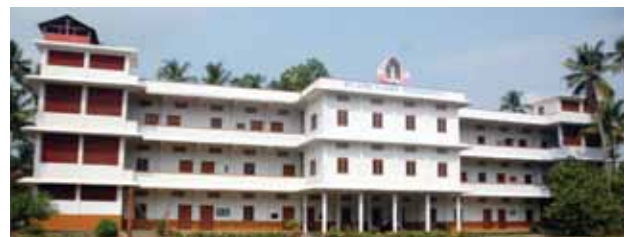
സെന്റ് ആൻസ് കോൺവെന്റ് ഹയർ സെക്കന്ററി സ്കൂൾ