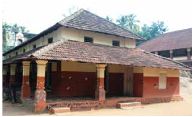
സെന്റ് ആൻസ് കോൺവെന്റ് യു.പി. സ്കൂൾ