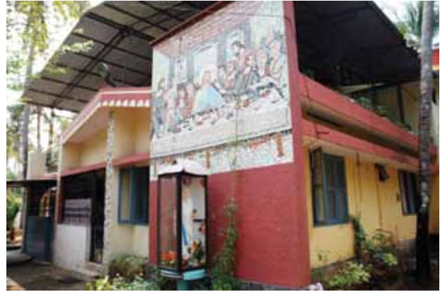
A.S.M.I അസ്സീസി കോൺവെന്റ്