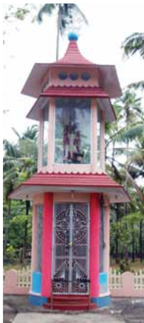
ലിറ്റിൽ ഫ്ളവർ കപ്പേള (ചുങ്കം)