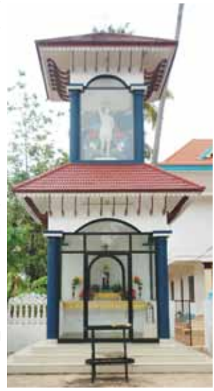
വി. അന്തോണീസിന്റെ കപ്പേള (പള്ളിയോടുചേർന്ന്)