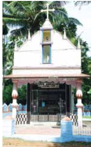
സെന്റ് സെബാസ്റ്റ്യൻസ് കപ്പേള കിഴക്കുംമുറി