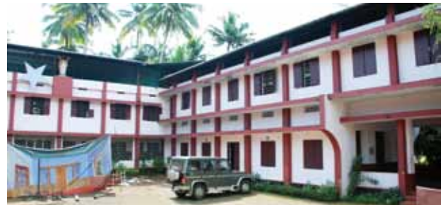
കരുണാലയം ബോയ്സ് ഹോം (MMB)