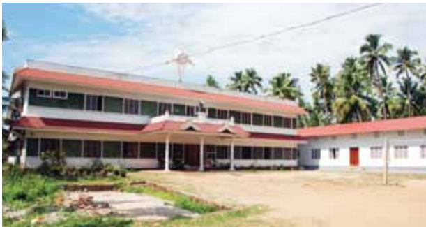
ലാറ്റിൻ സെമിനാരി (കോട്ടപ്പുറം രൂപത)