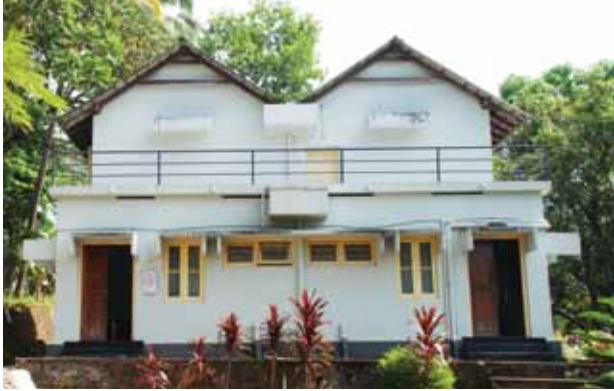
ജീവയാര റിന്യാവൽ സെന്റർ

ഒരേക്കർ സ്ഥലം സംഭാവന ചെയ്തത് ഡൊമിനിക്കൻ സിസ്റ്റേഴ്സ് ആകുന്നു.