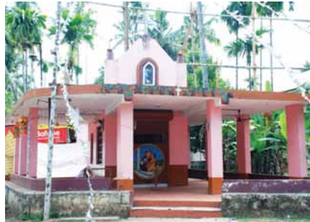
വി. സെബസ്ത്യാനോസ് കപ്പേള പടിഞ്ഞാട്ടുംമുറി