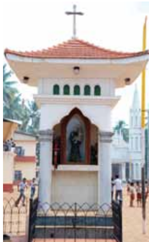
സെന്റ് ആന്റണീസ് കപ്പേള