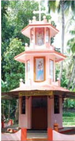
ചെറുപുഷ്പം ക്ഷേത്ര തെക്കുംമുറി