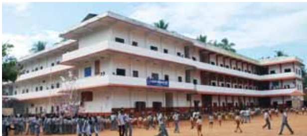
സെന്റ് സെബാസ്റ്റ്യൻസ് പ്രൈമറി & ഹൈസ്കൂൾ