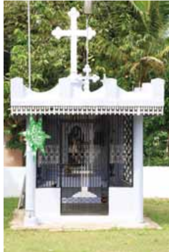
വി. ഗീവർഗ്ഗീസ് ക്ഷേത്ര