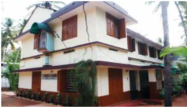
മേഴ്സി ഹോം ഓർഫനേജ്