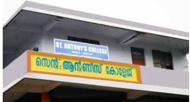
സെന്റ് ആന്റണീസ് കോളേജ്

പള്ളി നേരിട്ട് 1996-ൽ വനിതകളുടെ ഉന്നത വിദ്യാഭ്യാസവും മൂല്യബോധവും ലക്ഷ്യമാക്കി ആരംഭിച്ച സെന്റ് ആന്റണീസ് കോളേജ് പ്രീ-ഡിഗ്രി, ഡിഗ്രി കോഴ്സുകൾക്ക് പുറമെ 2007-ൽ ബിരുദാനന്തര ബിരുദ കോഴ്സുകൾ കൂടി ആരംഭിച്ചു.