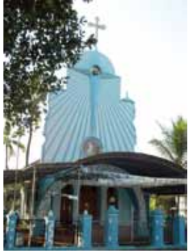
സെന്റ് സെബാസ്റ്റ്യൻ കപ്പേള, കാവനാട്