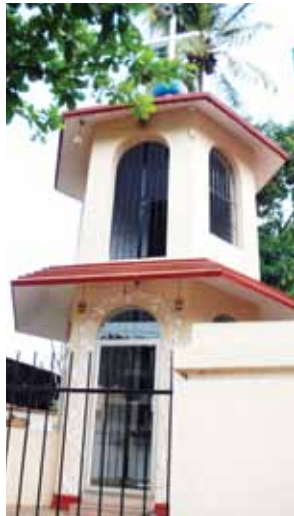
കപ്പേള (ഗവ. ആശുപത്രിക്ക് സമീപം)