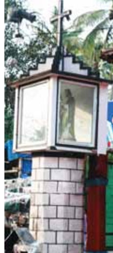
തിരുക്കുടുംബ കപ്പേള, കോട്ടമുറി