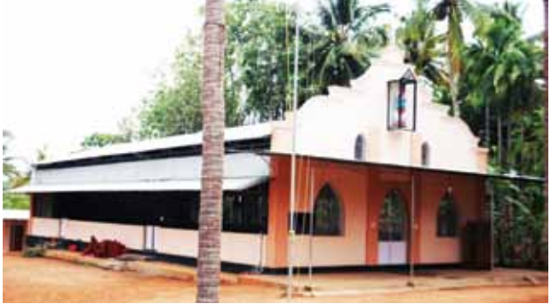
മേരി റോസറി പള്ളി, വടമ