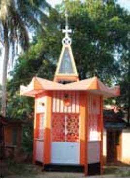
സെന്റ് തോമസ് കപ്പേള ദയാനഗർ