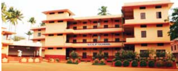
സൊക്കോർസോ എൽ.പി. സ്കൂൾ