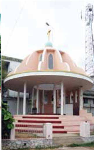
സെന്റ് ആന്റണീസ് കപ്പേള (പള്ളിയുടെ മുൻവശം)