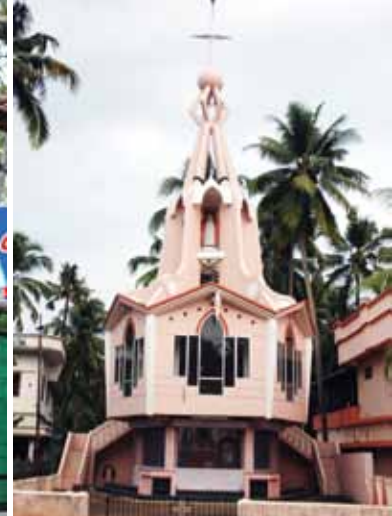
സെന്റ് സെബാസ്റ്റ്യൻ കപ്പേള വടമ