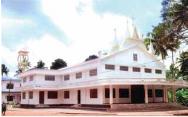
സൊക്കോർസോ കോൺവെന്റിന്റെ നവീന ദേവാലയം

ആദ്യ കാലങ്ങളിൽ പല ഘട്ടങ്ങളിലും അമ്പഴക്കാട് കോട്ടയ്ക്കൽ ആശ്രമ ദേവാലയത്തിൽ നിന്നും അച്ചന്മാർ പള്ളിയിൽ സേവനം അനുഷ്ഠിച്ചിട്ടുണ്ട്.