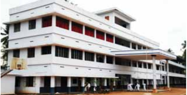
സെന്റ് ആന്റണീസ് ഹയർ സെക്കന്ററി സ്കൂൾ

പള്ളിയിൽ നിന്ന് നിർമ്മിച്ച നാമമാത്രമായ വാടകയ്ക്ക് സർക്കാരിന് കൊടുത്തിരുന്ന സ്ഥലത്തായിരുന്നു ഈ പ്രദേശത്തെ ആദ്യത്തെ പ്രാഥമിക വിദ്യാലയമായ ഗവണ്മെന്റ് എൽ.പി. സ്കൂൾ പ്രവർത്തിച്ചുകൊണ്ടിരുന്നത്. 1917-ൽ പള്ളിയിൽനിന്നും നിർമ്മിച്ച മിഡിൽ സ്കൂൾ കെട്ടിടത്തിന്റെ ശിലാസ്ഥാപനം നിർവ്വഹിച്ചത് അന്നത്തെ കൊച്ചി ദിവാൻ ആയിരുന്ന സർ ജോസഫ് ബോർ ആയിരുന്നു. വലിയൊരു തുക പള്ളിയിൽ നിന്നും ചെലവഴിച്ച് കെട്ടിടങ്ങളും ഉപകരണങ്ങളും ഉണ്ടാക്കി സർക്കാരിനെ ഏല്പിച്ചിട്ടാണ് ഒരു മിഡിൽ സ്കൂൾ മാളയിൽ ആരംഭിക്കുവാൻ ഗവണ്മെന്റ് തയ്യാറായത്. 1918 മുതൽ 1927 വരെ ഈ കെട്ടിടത്തിൽ വാടകകൂടാതെ ഗവണ്മെന്റ് മിഡിൽ സ്കൂൾ നടത്തി. സ്കൂൾ നടത്തിപ്പിലുണ്ടായ നഷ്ടം കാരണത്താൽ 1927-ൽ കൊച്ചി ഗവണ്മെന്റ് മിഡിൽ സ്കൂൾ