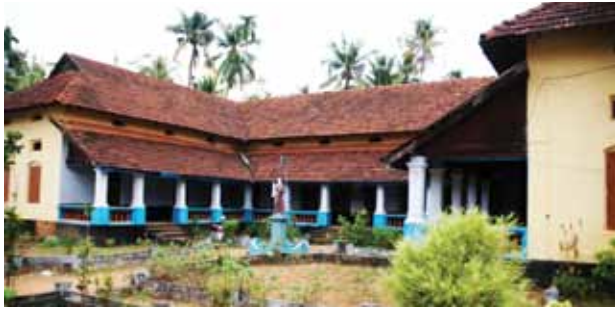
സെന്റ് ആന്റണീസ് ഹൈസ്കൂൾ

നിർമ്മാണത്തിന് തീരുമാനിച്ചു. എന്നാൽ, ഇടവക സമൂഹം ഒരു കമ്മിറ്റി ഉണ്ടാക്കി സ്കൂൾ മാനേജ്മെന്റ് പള്ളി ഏറ്റെടുത്തു.