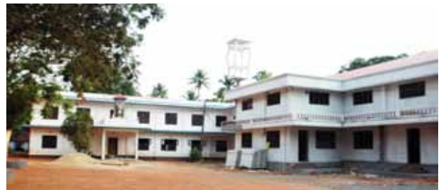
സൊക്കോർസോ സി.എം.സി. കോൺവെന്റ്

1977-ൽ ആരംഭിച്ച മെഴ്സി ഹോം എന്ന ബാലികാഭവനത്തിൽ 100 വിദ്യാർത്ഥിനികൾക്ക് താമസസൗകര്യം