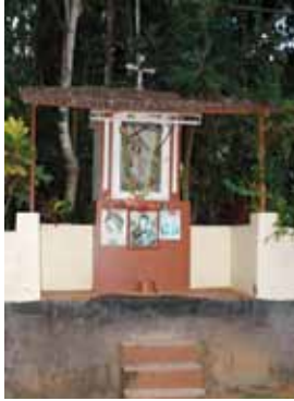
സെന്റ് സെബാസ്റ്റ്യൻ കപ്പേള, കൊടവത്തുകുന്ന്