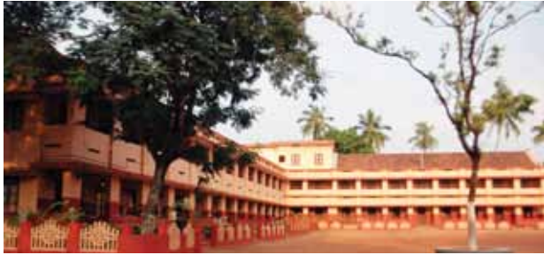
സൊക്കോർസോ ഹയർസെക്കന്ററി സ്കൂൾ