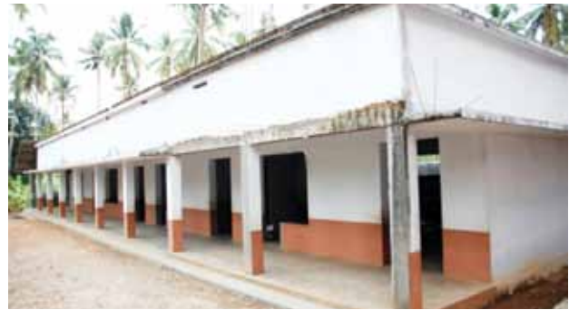
സി.ബി.എസ്.ഇ. പള്ളി സ്കൂൾ