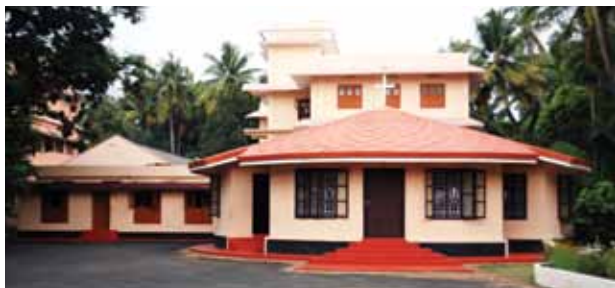
കാർമ്മൽ സി.എം.സി. കോൺവെന്റ്