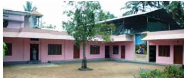
എസ്.ഡി. കോൺവെന്റ് & കരുണാഭവൻ

ദരിദ്രരും നിരാലംബരുമായ വൃദ്ധജനങ്ങൾക്കു വേണ്ടി 1989-ൽ അഗതികളുടെ സിസ്റ്റേഴ്സ് (S.D.) തുടങ്ങിയ ജീവകാരുണ്യ സ്ഥാപനമാണ് കരുണാഭവൻ. മുപ്പതോളം സ്ത്രീപുരുഷന്മാരെ താമസിപ്പിച്ച് സൗജന്യമായ ഭക്ഷണവും, പരിചരണവും, ചികിത്സയും സ്ഥിരമായി നൽകുന്നതോടൊപ്പം ബഹു. സിസ്റ്റേഴ്സ് ഇടവകയിലെ വിവിധ ശുശ്രൂഷകളിൽ കണ്ടറിഞ്ഞ് സഹായിക്കുന്നു.