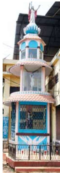
സെന്റ് ആന്റണീസ് കപ്പേള നെല്ലായി