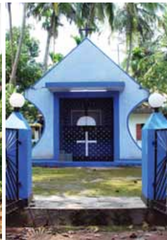
സെന്റ് സെബാസ്റ്റ്യൻ കപ്പേള പന്തല്ലൂർ