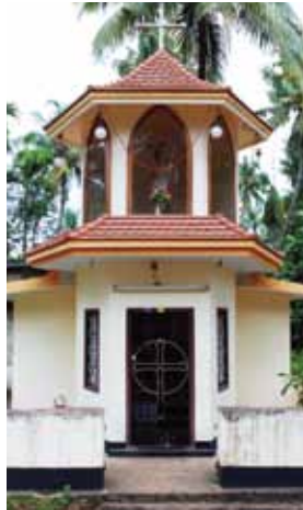
വേളാകണ്ണിമാതാ കപ്പേള കുളത്തൂർ

ഇടവകാതിർത്തികളിൽ ഇപ്പോൾ ഒരു കുരിശുപള്ളിയും 5 കപ്പേളകളും 9 കുടുംബയൂണിറ്റുകളുമുണ്ട്. മൊത്തം 440 കത്തോലിക്കാ കുടുംബങ്ങളാണുള്ളത്. പോങ്കോത്ര കുരിശുപള്ളിയിൽ ഇപ്പോൾ രണ്ട് ഞായറാഴ്ചകളിലും രണ്ട് ശനിയാഴ്ചകളിലുമായി മാസത്തിൽ നാല് കുർബാന അർപ്പിച്ചുവരുന്നു.