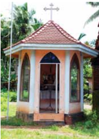
സെന്റ് ജോസഫ് കപ്പേള കുളത്തൂർ

1978-ൽ ഇരിങ്ങാലക്കുട രൂപത ജന്മം കൊണ്ടപ്പോൾ ഇടവകയുടെ അതിർത്തികളിലും മാറ്റം വന്നു. കിഴക്ക് കുറുമാലിപ്പുഴ, പടിഞ്ഞാറ് അമത്തും കുഴി പാലം, തെക്ക് കൊളത്തൂർ പാടം, വടക്ക് നന്തിക്കര ഗവണ്മെന്റ് സ്കൂൾ എന്നിങ്ങനെ അതിരുകൾ നിശ്ചയിച്ചു. ഇടവകയായി ഉയർത്തപ്പെട്ടതിന്റെ രജത ജൂബിലി 1983-ൽ ആഘോഷിച്ചു.