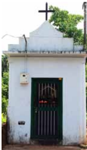
സെന്റ് ആന്റണീസ് കപ്പേള പന്തല്ലൂർ