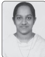
Pos. Shereena C.B. Udaya Pro. House Irinjalakuda