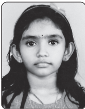
AgnaTixan St. Sebastian's LPS, Kuttikad